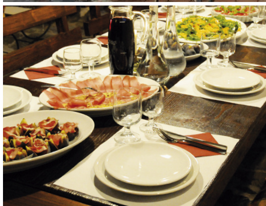
und am Abend... a tavola!