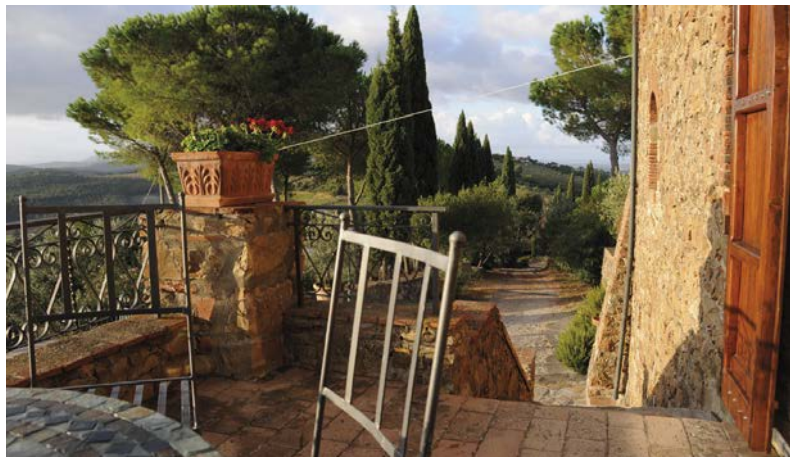
Frühstücksplatz mit Aussicht ...

Die hier erhobenen Daten werden entsprechend der gesetzlichen Datenschutzbestimmung behandelt. Sie dienen nur der Anmeldeabwicklung und Organisation der Kurse und werden nicht an Dritte weitergegeben.