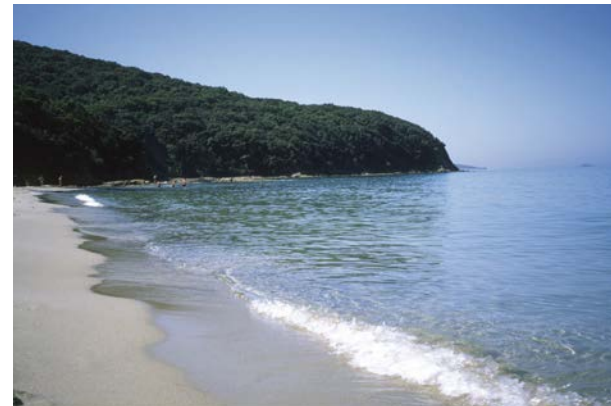
Cala Violina „unser“ Strand